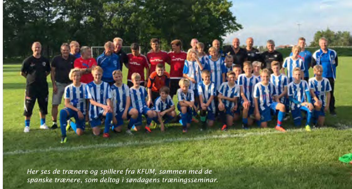
Her ses de trænere og spillere fra KFUM, sammen med de spanske trænere, som deltog i søndagens træningsseminar.

- Desuden havde vi stort udbytte af det seminar for børne- og ungdomstrænere, som spanierne gennemførte, dagen før fodboldskolen begyndte. Her har det siden været en stor glæde at konstatere,