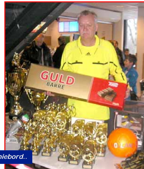
Iben ved sidste års præmiebord..