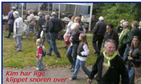
Kim har lige klippet snoren over..

LOPPE-MARKEDET var godt besøgt. Der blev set på legetøj og meget andet.. Hunden var dog ikke til salg..