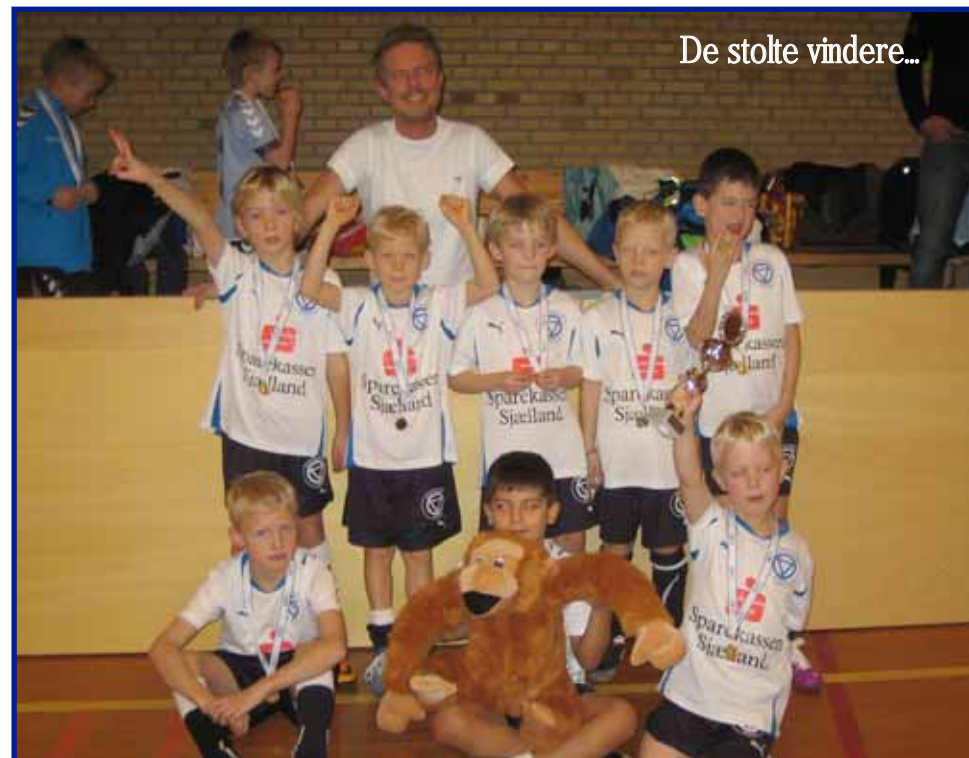
De stolte vindere...

derhjemme i en uge, hvorefter den går på skift mellem de øvrige spillere, inden den finder sin plads i klubbens pokalskab.